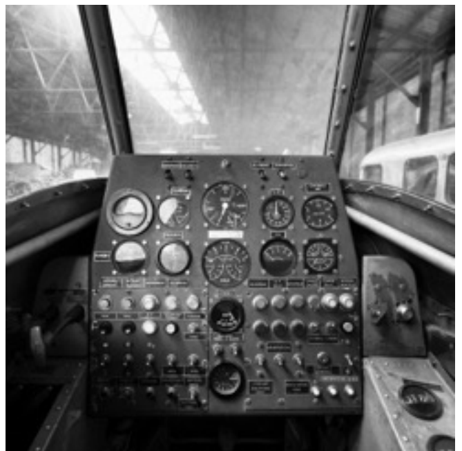
COCKPIT DE L'AEROTRAIN 02