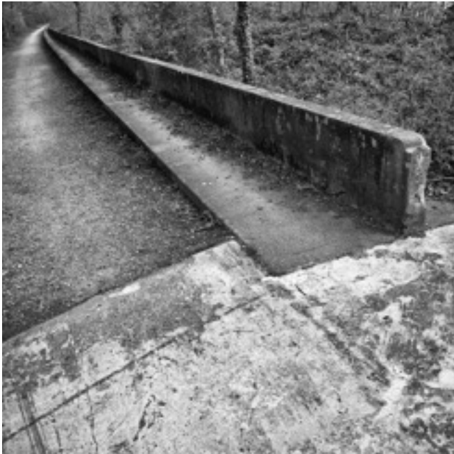
TERMINUS DU RAIL TERRESTRE GOMETZ-LIMOURS