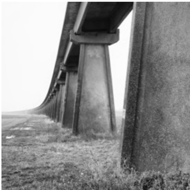
VIADUC DE L'AÉROTRAIN DE JEAN BERTIN, PILIER 778