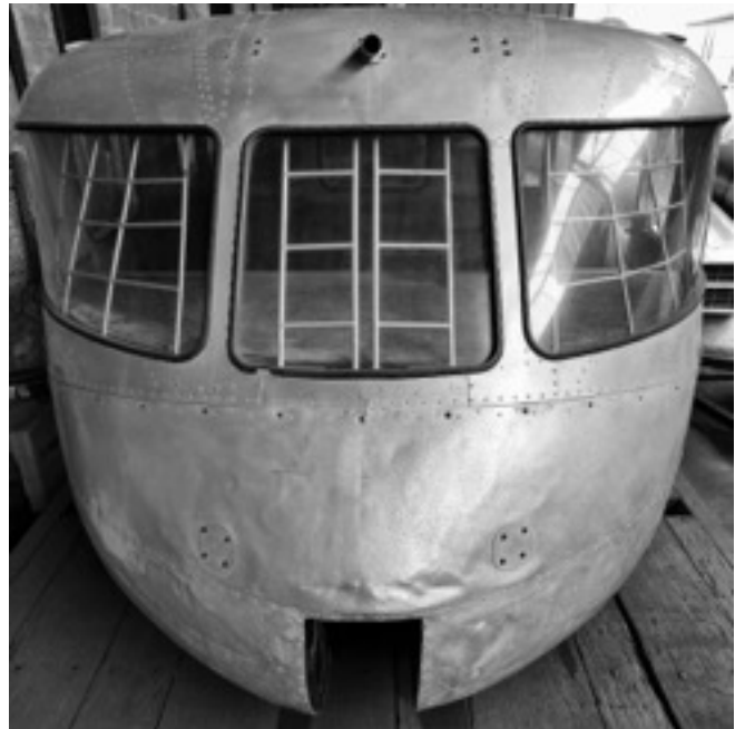
AEROTRAIN NO 1